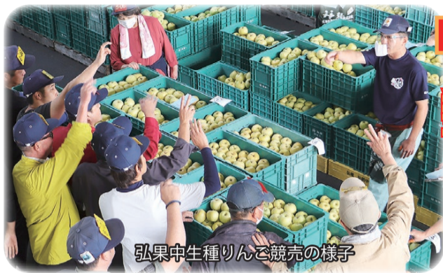
弘果中生種りんご競売の様子