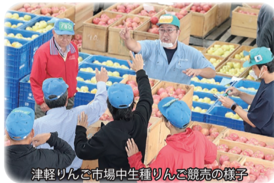
津軽りんご市場中生種りんご競売の様子

当社と津軽りんご市場において9月中旬から下旬にかけて、中生種「トキ」「早生ふじ系」の本格的な販売が始まりました。 現在までの入荷状況は、記録的な猛暑日が続いたことや少雨の影響から、高温障害による落果、ヤケ果の増加、着色遅れ等により、昨年と比較して取扱数量が減少しました。また「トキ」は、熟度が進んだことにより、前進出荷となりましたが、「早生ふじ系」は、夜温が高かったことで着色が遅れ、平年よりも収穫が遅くなりました。 販売面において「トキ」は海外需要の高まりから、「早生ふじ系」は、早生種「サンツがる」の在庫量が少なかったことで、消費地からの引き合いが強く、活発な取引となりました。 当社の取扱いは、10月13日までの累計は、「トキ」が数量17万8千箱(前年比89.5%)、平均単価4649円(同139.5%)、「早生ふじ系」が数量26万8千箱(同85.9%)、平均単価5513円(同139.9%)となりました。津軽りんご市場の取扱いは(10月13日までの累計)は、「トキ」が数量9万3千箱(前年比98.8%)、平均単価4561円(同142.9%)、「早生ふじ系」が数量16万1千箱(同94.7%)、平均単価5244円(同142.2%)となりました。