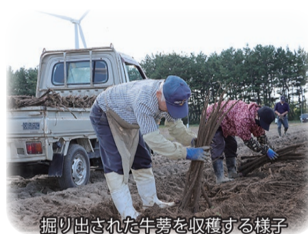
掘り出された牛蒡を収穫する様子

シャインマスカット出荷に際してのコンテナの貸し出し及び、冷蔵貯蔵販売については、当社果実部までご連絡ください。